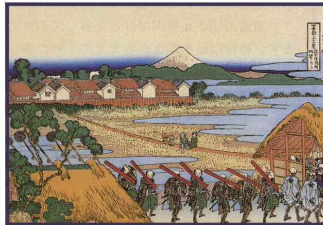
葛飾北斎描く千住より眺望の富士

例会日 木曜日 12:30~13:30 例会場 上野精養軒 TEL.03(3821)2181 事務所 〒130-0013 東京都墨田区錦糸1-1-5Aビル6F TEL.03(5637)4602 FAX.03(5637)4611 http://www.tokyo-kohoku-rc.org