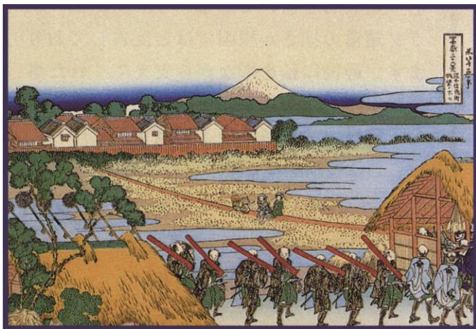
葛飾北斎描く千住より眺望の富士

例会日 木曜日 12:30~13:30 例会場 上野精養軒 TEL.03 (3821) 2181 事務所 〒130-0013 東京都墨田区錦糸 1-1-5 Aビル6F TEL.03 (5637) 4602 FAX.03 (5637) 4611 http://www.tokyo-kohoku-rc.org