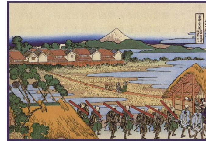
葛飾北斎描く千住より眺望の富士