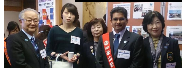
D2550(宇都宮)地区大会 フィリピンの同期ガバナー