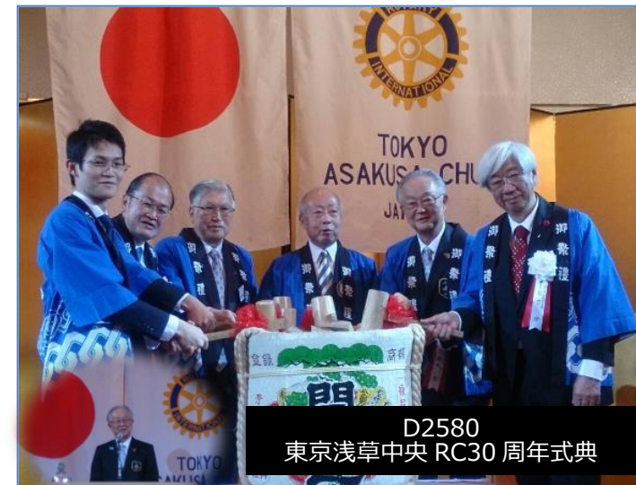
D2580 東京浅草中央 RC30 周年式典