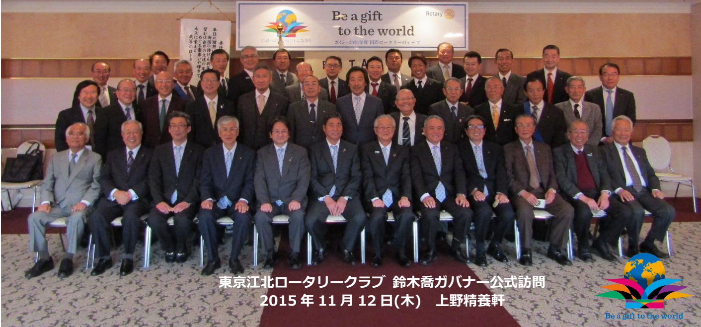
東京江北ロータリークラブ 鈴木喬ガバナー公式訪問 2015年11月12日(木) 上野精養軒