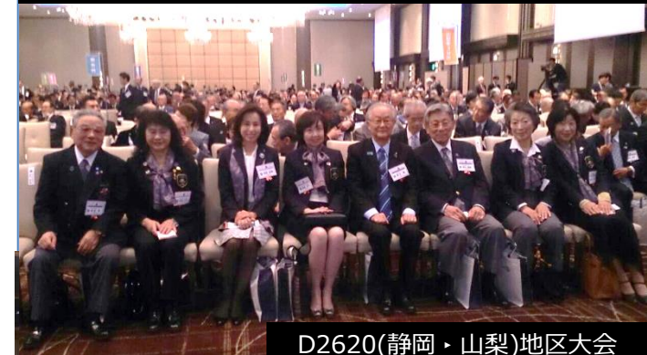
D2620(静岡・山梨)地区大会