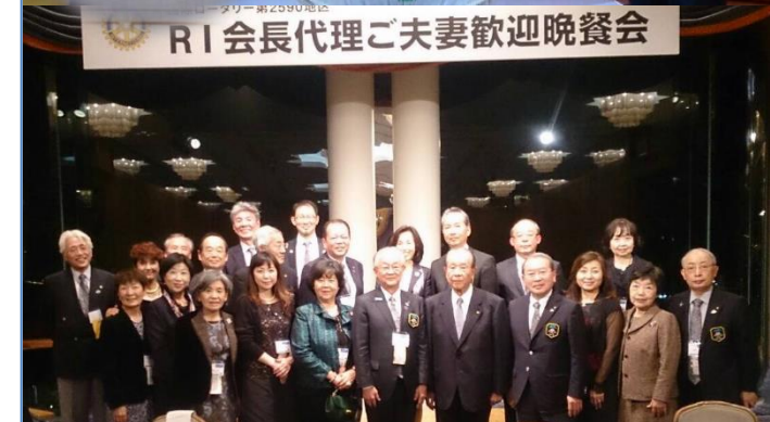
RI 会長代理ご夫妻歓迎晩餐会 D2590(横浜・川崎)地区大会 小沢米山理事長と同期ガバナー会