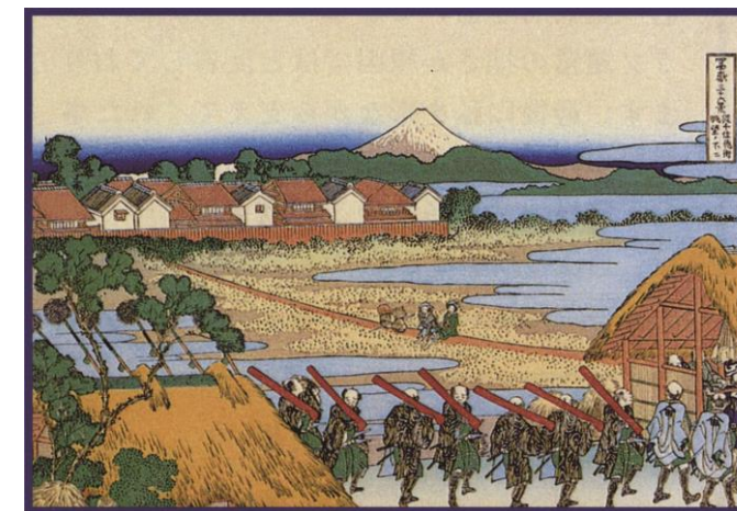
葛飾北斎描く千住より眺望の富士