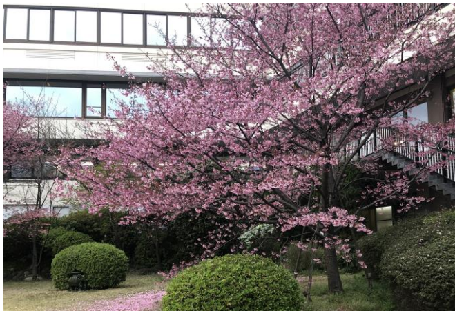
上野精養軒 お庭の桜

2019 年 3 月 28 日 第 2853 回例会報告 江北・葛飾・足立 3クラブ合同例会