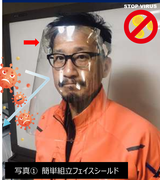
写真① 簡単組立フェイスシールド