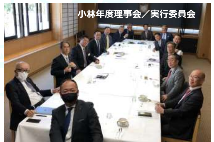
小林年度理事会 / 実行委員会