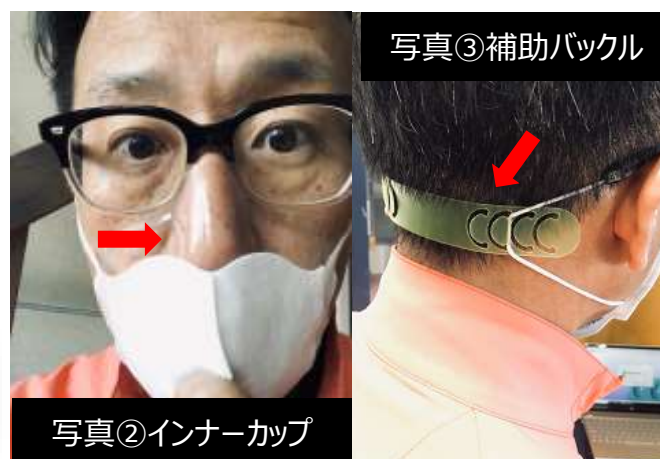
写真③補助バックル