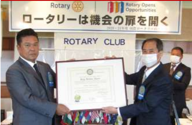
エンブレムの引継ぎ