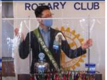
地区派遣委員 委嘱状授与