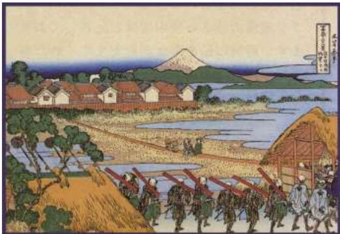
葛飾北斎描く千住より眺望の富士

例会日 木曜日 12:30~13:30 例会場 上野精養軒 TEL.03 (3821) 2181 事務所 〒130-0013 東京都墨田区錦糸 1-1-5 A ビル 6F TEL.03 (5637) 4602 FAX.03 (5637) 4611 http://www.tokyo-kohoku-rc.org